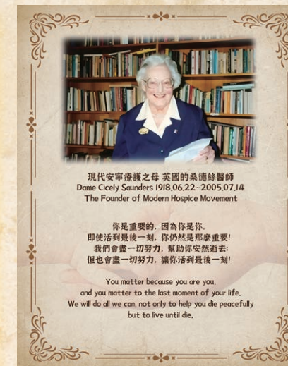
現代安寧療護之母 英國 桑德絲醫師