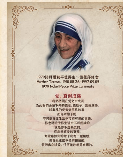
1979 諾貝爾和平獎得主 德蕾莎修女