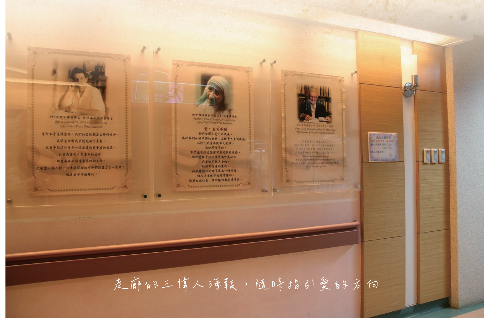
走廊的三偉人海報，隨時指引愛的方向