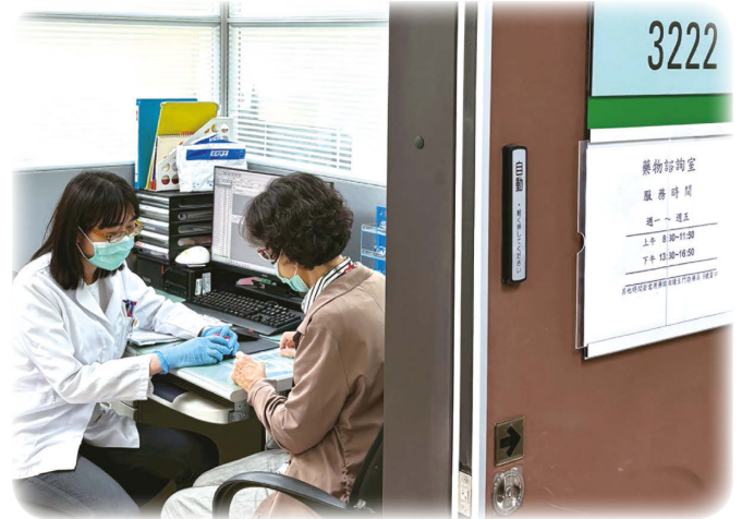
▲ 本院設有藥物諮詢室於門診後棟 2F3222 室，歡迎民眾多加利用。

出國旅遊令人期待，但時差、氣候變化、飲食改變及長途移動，常讓身體出現不適；加上海外就醫不便、語言溝通困難，行前做好藥品準備格外重要。建議出發前一至兩週諮詢藥師，依個人健康狀況備齊所需藥品，讓旅程更加安心。