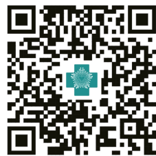
GO 影片 QR 碼

吞嚥會痛、肚子悶悶還越來越瘦？別以為只是胃不舒服！黑便、貧血、想吐也可能是身體在發出警訊。高風險族群可與醫師討論是否需內視鏡檢查，及早評估，讓自己更安心。