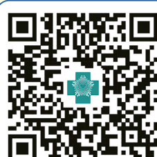
GO 影片 QR 碼

從日常做起，就能大幅降低發生機率。多吃高纖食物、多喝水、如廁避免久坐、養成運動習慣。醫師提醒，肛門出血不一定是痔瘡，嚴重時可能與其他腸道疾病有關。若出現出血、疼痛或腫脹，及早就醫評估最安心！